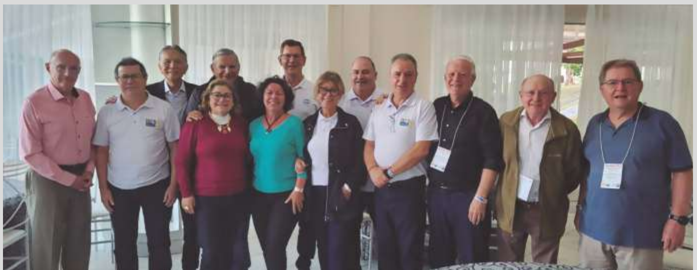
AFABB/PR presente no 13º Encontro Sulbrasileiro de AFABBs.

Finalizando o evento, os anfitriões do 13º Encontro Sulbrasileiro de AFABBs, se reuniram e confirmaram a realização do 14º Encontro em 2024.